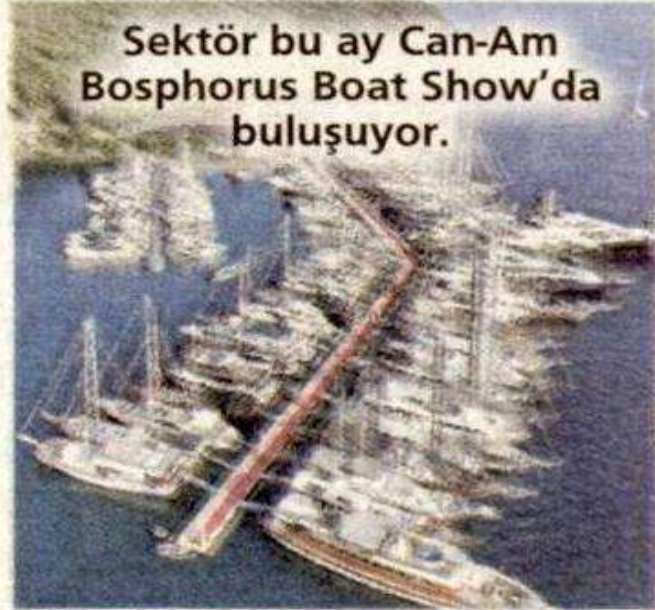
Sektör bu ay Can-Am Bosphorus Boat Show'da buluşuyor.