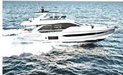
Fuarın en büyüğü: Azimut 78 Fly