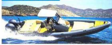
Rock Marine'in 30 fit uzunluğundaki botu Yunanistan'da üretiliyor.