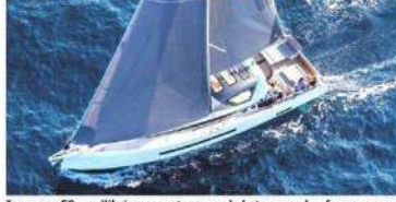
Jeanneau 55, yenilikçi ve cesur tasarımıyla katamaran konforu sunuyor.