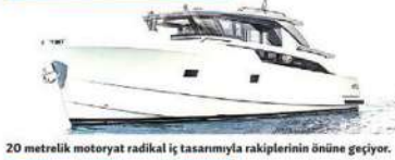
20 metrelük motoryat radikal iç tasarımıyla rakiplerinin önüne geçiyor.