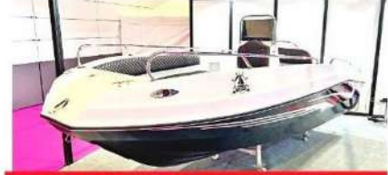
Hataylı öğrenciler yaptı

Tam uzunluğu 23,64 metre olan tekne fuarın en büyüğü konumunda. 4+1 kabin seçeneği sunan tekne, maksimum hızda 31-33 knot'a ulaşabiliyor. Kendi kategorisinde mutfak ve mürettebat için tamamen bölünmüş alanlar düzenleyen tekne, 8 kişilik bir ağırlama imkanı sunuyor.