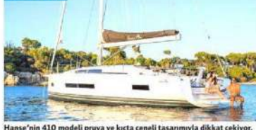
Hanse'nin 410 modeli pruva ve kıçta çeneli tasarımıyla dikkat çekiyor.