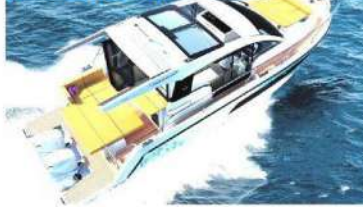
Hanse'nin bu modeli 300 PS güce sahip dıştan takma iki motora sahip.