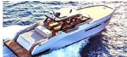
Fuarın en büyük yerlisi Mazu 52

YATED'in destek verdiği Hatay İskenderun'daki Sefa Atakaş Denizcilik Mesleki ve Teknik Anadolu Lisesi öğrencilerinin yaptığı balıkçı teknesi de fuarın ilgi görenleri arasındaydı. Yaşanan deprem felaketi sonrası harekete geçen YATED, öğrencilerin yaptığı 4,65 metre uzunluğa sahip tekneler için alım garantisi verdi.